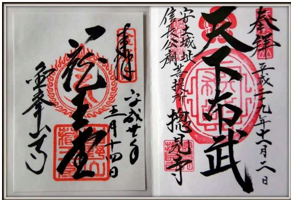
左:玉置神社/玉石社、右:大峯山寺