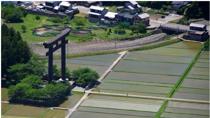
後3km、それでも↑凸凹↓を忠実にルートは辿る。