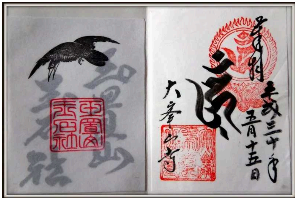
左:熊野本宮大社、右:玉置神社