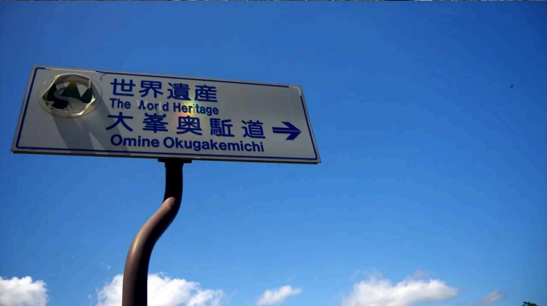
熊野本宮大社旧社地「大斎原」の大鳥居