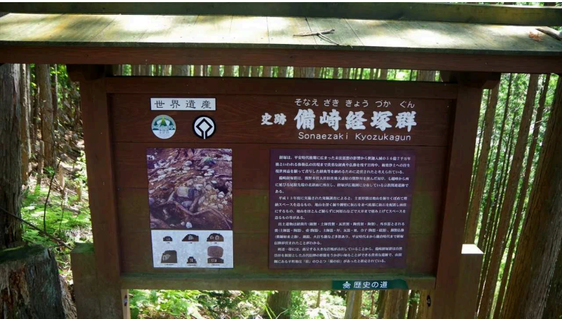
この看板をこれで最後かな？