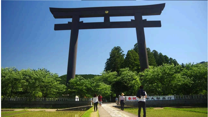
熊野本宮大社。 ゴール