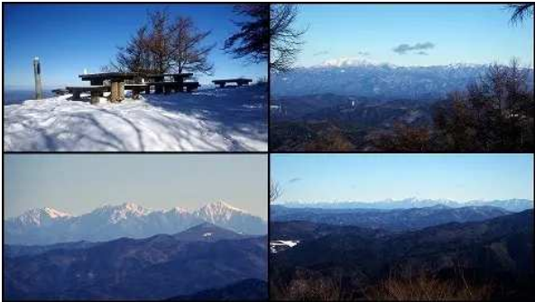
富士山から大好きな南アルプスオールスターズ。 望遠ズームをもってこれば……