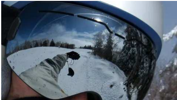
雲海も素晴らしい。