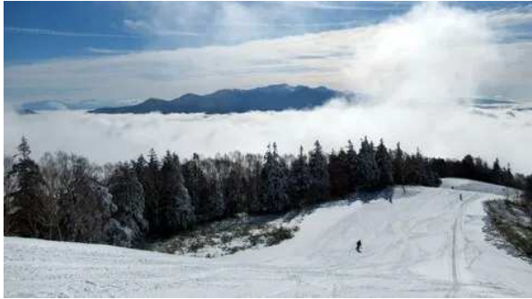
スキー場のブログ。