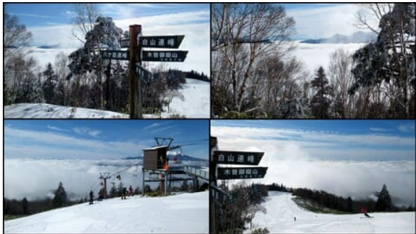
皆さん景色にうっとり。