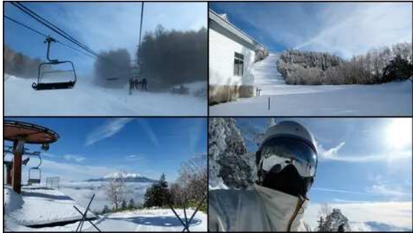
昨日上部は雪で下部は雨だったようだ。