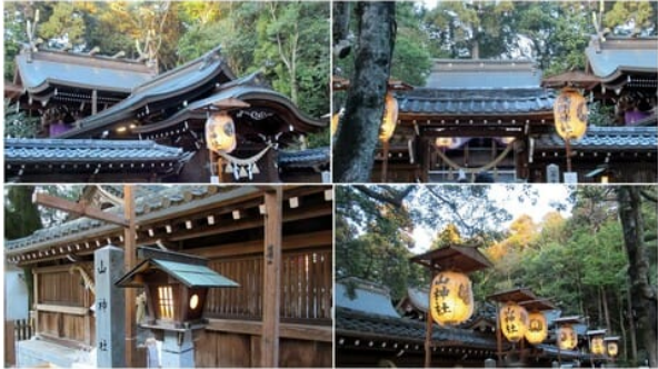
多賀神社の詳細は以前の記録で

木花咲耶姫に会いに、尾張多賀神社(常滑市) - トドクロちゃん和山登り 木花咲耶姫命(コノハナサキヤヒメノミコト)に興味があり祀られている神社へお詣りに出かける。この尾張多賀神社は娘の19才厄と私の後厄のお祓いの場所です。まだ新年の... goo blog