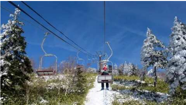
高速なクワッド(第2)を多用し滑るがそろそろ足にきた。