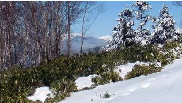
この場所からでは中アも南アも御嶽山には敵わない。