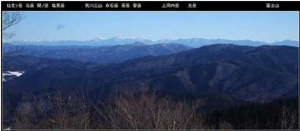
ショット拡大。右下が富士山。