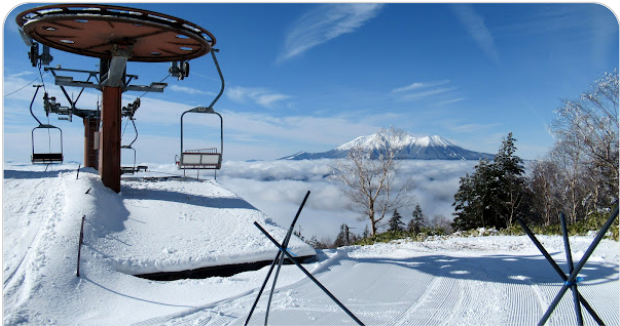
2024.01 木曽福島スキー 19 new items · Album by Inakun Masakun