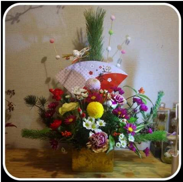
※トドクロちゃんの正月用アレンジ♪