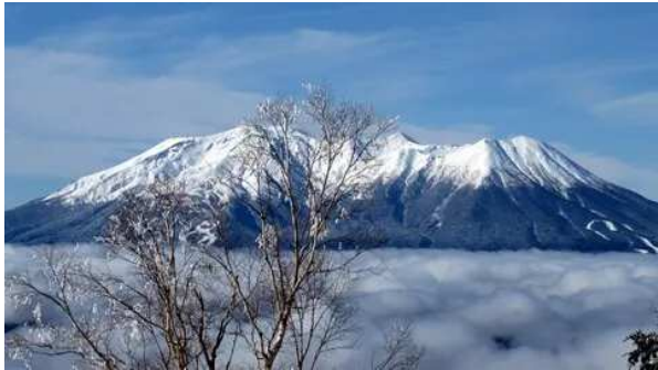
藪原スキー場が最後まで迷ったがこの眺望期待に軍配が上った。