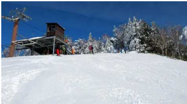
気温上昇が早く昼近くには雪が溶け出した。