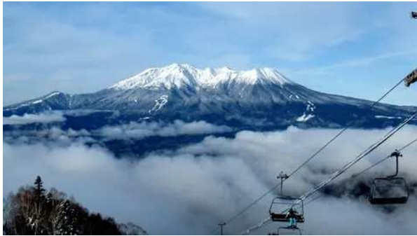
10時第3リフトが動き出した。 スキー場の最上部へ。