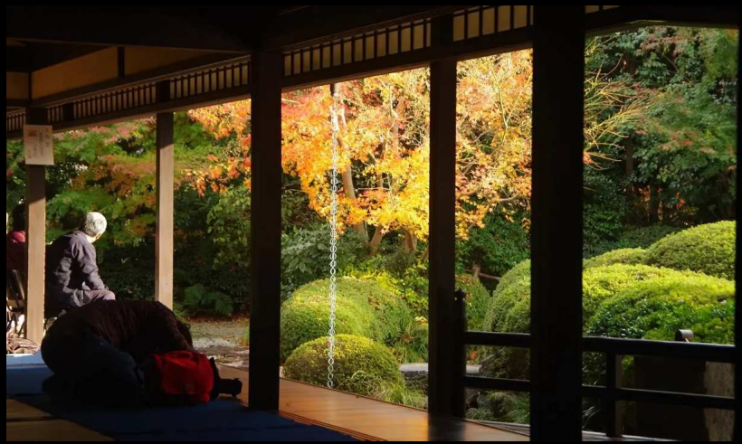
狭い階段を上がり紅葉を見下ろす。