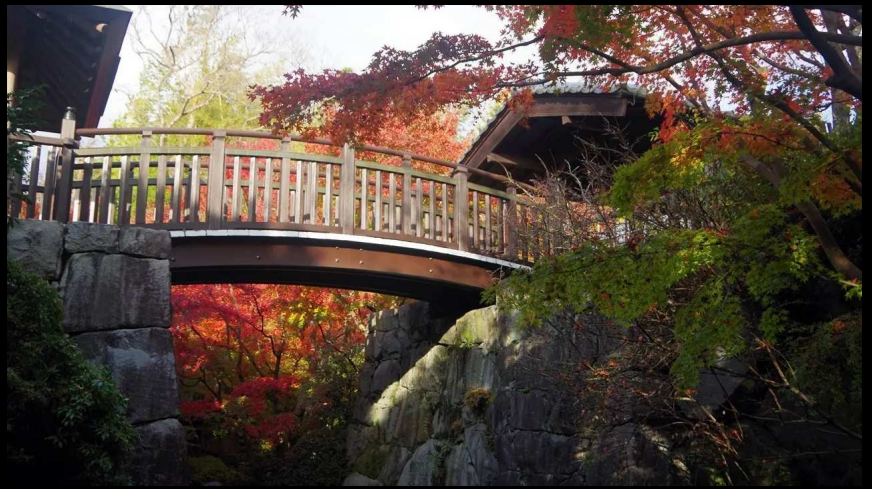
詩仙閣への石段の途中。