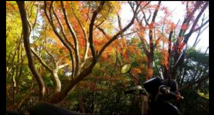
毎週水曜日の午前中はこの近くでテニスをしています。