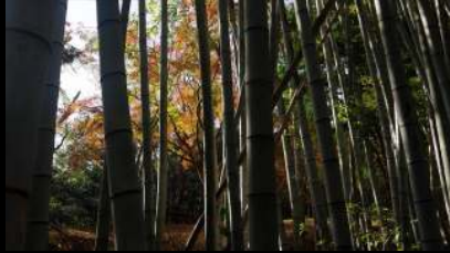
この辺りは結構紅葉している。