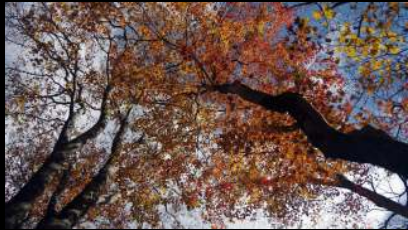
黄葉も少し残っています。 (黄葉が先に色づくので多くが落ち葉となっている)