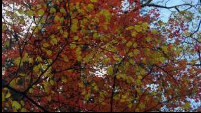
ブナの巨木。 枝振りの広がりが多い。