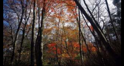
背の高い木々の紅葉①