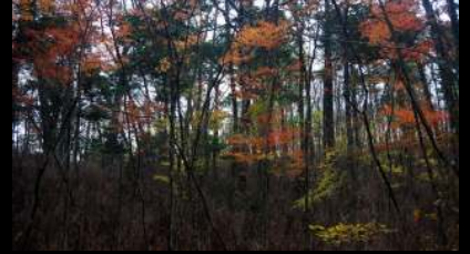
全ての画像はクリックすると大きくなります。