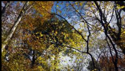
綺麗なので撮ってみたみたいですね。