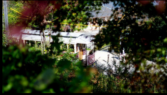
・紅葉と京都市電