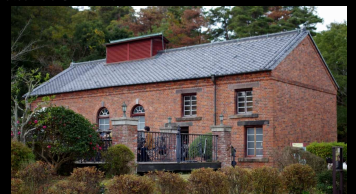
・正門の記念撮影場所