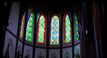
・工部省品川硝子製造所