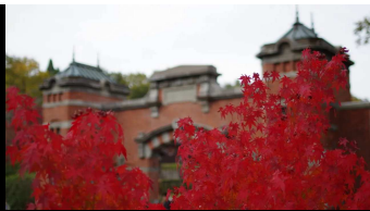
・帝国ホテル中央玄関

ここで食道案のコロッケ（コロッケ）などで遅い昼食。 併設の食堂は何処も長蛇の列であえなくここで。